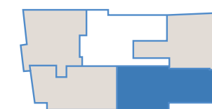
Ubicazione dell'appartamento rispetto al piano

La presente brochure pubblicitaria ha carattere meramente informativo e tutte le descrizioni e foto in essa contenute costituiscono indicazioni di massima circa ipotesi di soluzioni abitative, le cui caratteristiche finali potranno subire variazioni ed i cui termini effettivi e definitivi saranno solo ed esclusivamente quelli che verranno eventualmente contrattualizzati, per cui ogni diritto resta riservato alla soc. M.V.M.V. s.r.l.