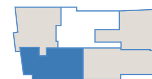
Ubicazione dell'appartamento rispetto al piano

La presente brochure pubblicitaria ha carattere meramente informativo e tutte le descrizioni e foto in essa contenute costituiscono indicazioni di massima circa ipotesi di soluzioni abitative, le cui caratteristiche finali potranno subire variazioni ed i cui termini effettivi e definitivi saranno solo ed esclusivamente quelli che verranno eventualmente contrattualizzati, per cui ogni diritto resta riservato alla soc. M.V.M.V. s.r.l.