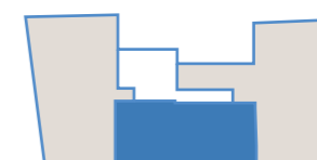
Ubicazione dell'appartamento rispetto al piano

La presente brochure pubblicitaria ha carattere meramente informativo e tutte le descrizioni e foto in essa contenute costituiscono indicazioni di massima circa ipotesi di soluzioni abitative, le cui caratteristiche finali potranno subire variazioni ed i cui termini effettivi e definitivi saranno solo ed esclusivamente quelli che verranno eventualmente contrattualizzati, per cui ogni diritto resta riservato alla soc. M.V.M.V. s.r.l.